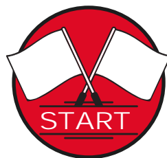
REGULARITY SZAKASZ RAJT