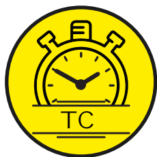
IDŐELLENŐRZŐ TIME CONTROL