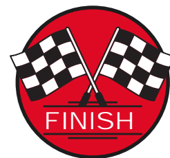
REGULARITY SZAKASZ CÉL

MINDEN ESETBEN ALKALMAZZUK A RAJT ÉS A CÉL JELEKET